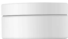
Creme / Zalf